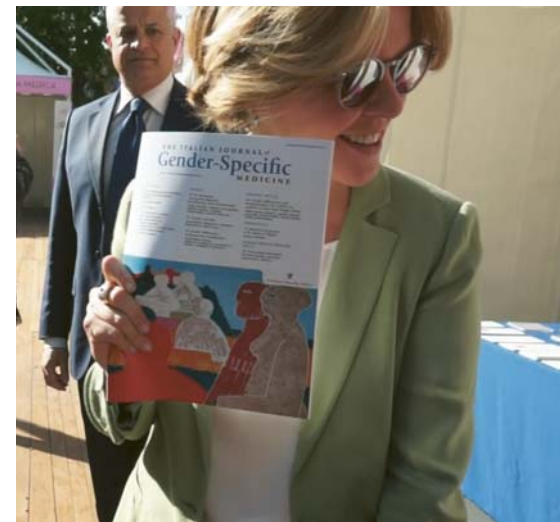
Il Ministro della Salute, Beatrice Lorenzin, alla 1ª Giornata nazionale della salute della donna.